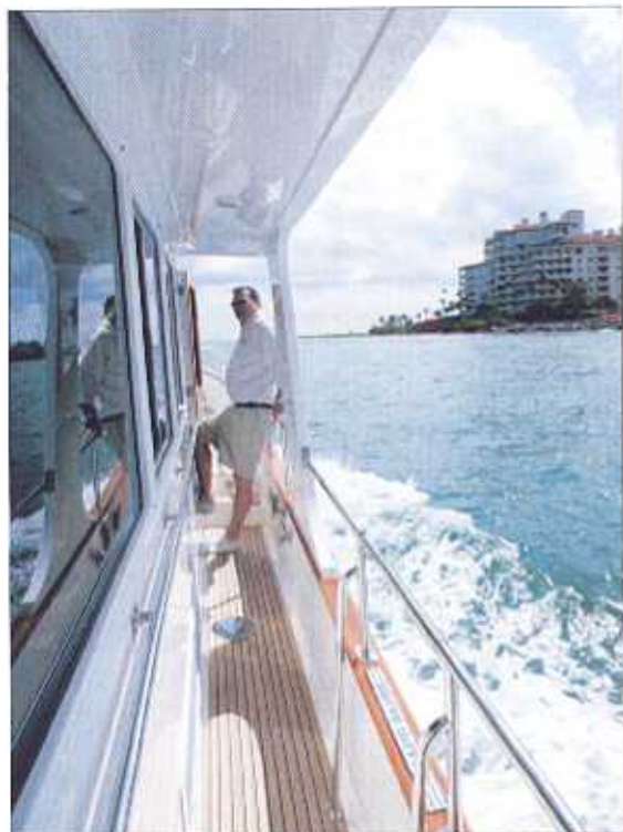
L'esthétique a dû parfois céder au sens pratique. Ainsi, la main courante en inox remplace la traditionnelle main courante en teck, exigeante en entretien.

Ci-dessous, les fauteuils signés Stidd, donnent fière allure au poste de pilotage extérieur.