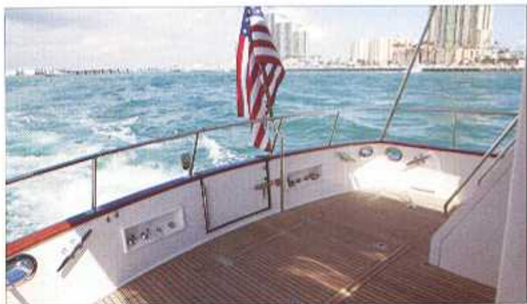
Une porte dans le tableau arrière facilite désormais l'accès à la plage de bain. Sachez que l'escalier de fly se soulève pour permettre l'accès à la salle des machines.

C'est finalement dans l'espace nuit que la touche Sparkman & Stephen est la plus spectaculaire. La cabine du propriétaire a été remaniée. Le lit double a été débarrassé des équipets latéraux qui empêchaient tout déplacement sur les côtés. Un grand dressing et un bureau cosy, avec un rabouret sur axe en inox pivotant, complètent l'aménagement. La porte sur tribord conduit à une salle de bains privative plutôt spacieuse. La chambre d'amis, un peu laissée pour compte sur le vieux GB 42, abandonne sa place sur bâbord à une seconde salle de bains. Elle occupe désormais le flanc tribord et prend de l'ampleur. La largeur généreuse du GB 44 fait des miracles ! D'autres améliorations techniques sont à porter au crédit des designers. On s'introduit dans la salle des machines en soulevant l'escalier de fly sur vérins. Une solution magique qui permet d'accéder plus aisément aux moteurs. De même, le peu fonctionnel mât ►